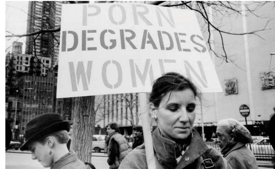
1980'lerin 'seks savaşları'

Hayır. Giderek narsist, kendine düşkün ve sığ oluyoruz ve özendiğimiz insanlar da tam olarak böyle! Bunun adı 'ünlü kültürü'; herkes sadece ünlü olmak için ünlü olmak istiyor. Genç kızlara hayatta ne yapmak istediklerini soruyorsunuz ve birçoğu sadece "Ünlü olmak" cevabını veriyor. Ne için ünlü? Kimbilir?! Bir işte çalışmak istemiyorlar; mükemmel makyaj yapmayı öğrenmek, müthiş kıyafetler giyip, sosyal medya sitelerinden 'arkadaş' edinmek, bütün o tatlı arkadaşlarıyla fotoğraflarını paylaşmak ve bir sürü selfie çekmek istiyorlar. Daha kötüsü ve ciddişi: Bence kızlar ve genç kadınlar, yeterli derecede seks eğitimi almadan (tabii eğer alıyorsa!), çok genç yaşlardan itibaren aşırı derecede cinselliğe maruz kalıyorlar. Bu Batı kültüründe yıkıcı bir trend; genç kızlar kendilerini enfeksiyonlardan, AIDS'ten ve hamilelikten nasıl koruyacaklarını bile bilmezken, cinsel olarak atak görünmekle ilgileniyorlar. Ben genç bir feministken en azından seksle ilgili kitaplar okurdum; sadece kendimizi nasıl koruyacağımızı değil, seksten zevk almanın hakkımız olduğunu da öğrenmiştik! Seksi sadece erkekler üzerinde performe etmiyorduk, onların da bizi tatmin etmesini istiyorduk! Ariel Levy'nin 'Şovenist Dişi Domuzlar' kitabı bu bakımdan önemlidir. ■